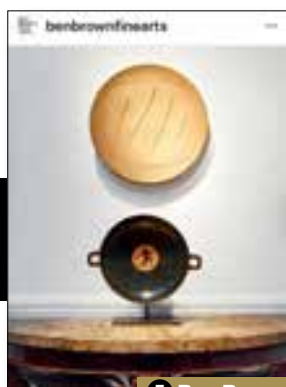
5 Ben Brown