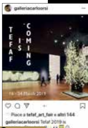
1 Carlo Orsi