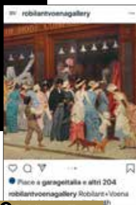
2 Robilant + Voena