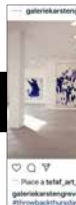
4 Galerie Karsten Greve