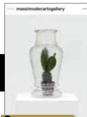
3 Massimo De Carlo